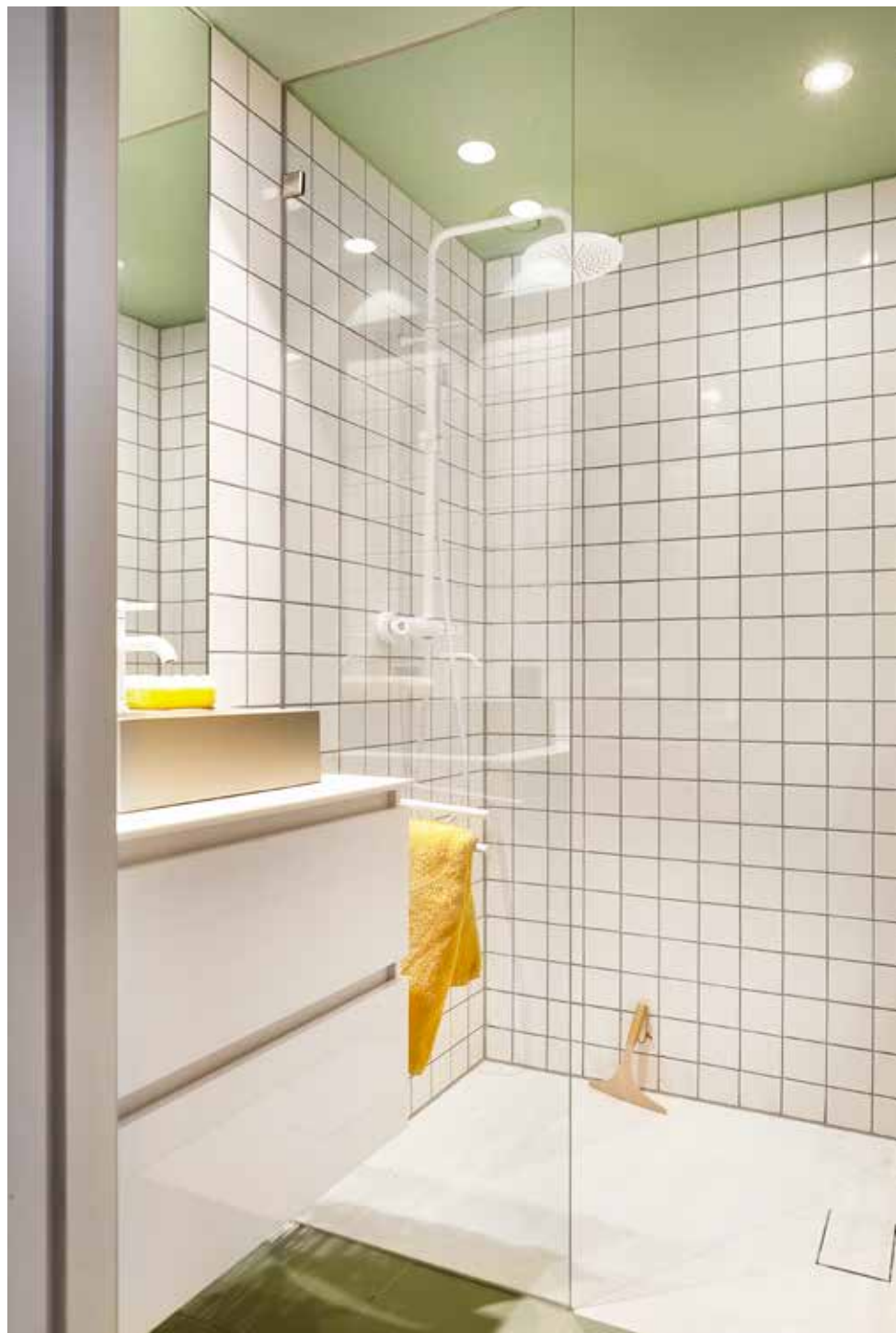
Klassieke tegels van 10 x 10 cm krijgen tegenwicht van vloertegels van 30 x 30 cm in olijfgroen, beide van Mosa. De spot van Modular Lighting is spatwaterbestendig. Douchevloer Stone van Axel. Regendouche van Bongio. Wastafelkraan van Ben Lavion. RECHTS Alle slaapkamers kregen een andere kleur. Deze is geveerd in Pleat 280 van Little Greene. Inbouwkasten op maat gemaakt door Gerrits. Passpiegel van Kwantum. Kruk van Houtenkrukjes. Gele lamp Jak van Made. Dekbedovetrek van Essenza.

'Afstappen van het wit, kiezen voor kleur: we zagen van begin af aan de toegevoegde waarde'