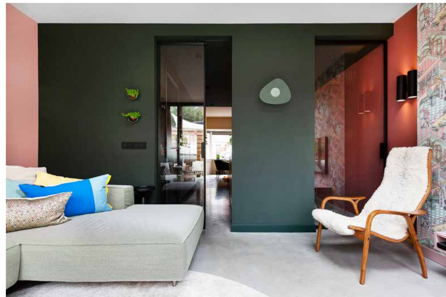
Bank 7780 van Gelderland, kussens Fest Amsterdam en Sissy-Boy. Fauteuil Lamino van Yngve Ekström voor Swedese. Wandlamp Pegg van LaForma. LINKS De stalen schuifdeuren tussen keuken en zithoek houden de zichtlijnen open. In behang Miami van Cole & Son komen alle gebruikte kleuren samen. Op de hele benedenverdieping ligt een vloer van gevulderd beton (Beton Midden Nederland). Barkrukken About a stool van Hay.

'We wilden het zo puberproof mogelijk maken, zodat we jaren vooruit konden'